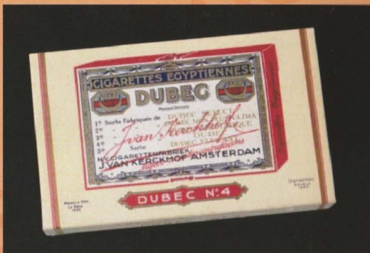
Merk overgenomen door Turmac tussen 1950-1955 Doosje met 25 ovale Egyptische cigarettten