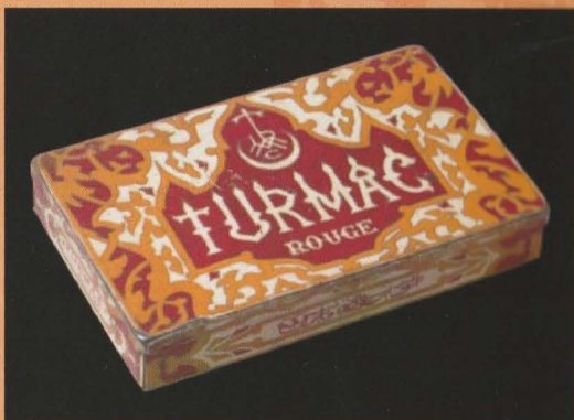
Blikverpakking ca.1925, inh. 25 cigarettten vervaardigd door Waldorf Astoria in Munchen-Stuttgart