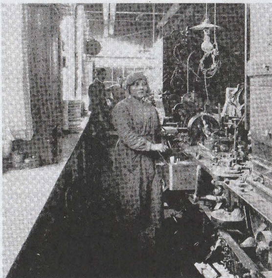
Sigaretten produceren toen leek op een chirurgische ingreep.

Turmac onderscheidde zich in de twintiger jaren niet van andere sigarettenfabrieken maar in 1927 werd dat anders. In Duitsland gebruikte