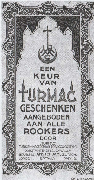
De voorzijde van de Turmac geschenkencatalogus, waarin zelfs radio's werden aangeboden.

de nieuwe U.G.- machines op volle toeren draaien met een capaciteit van 300.000 sigaretten per dag (ja, gelijk aan totale dag productie van de beginjaren).